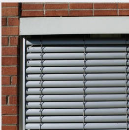
President monterad på utsidan av fönsterkarmen